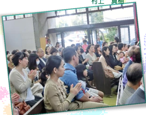
会場には100人以上の方が集まって下さいました