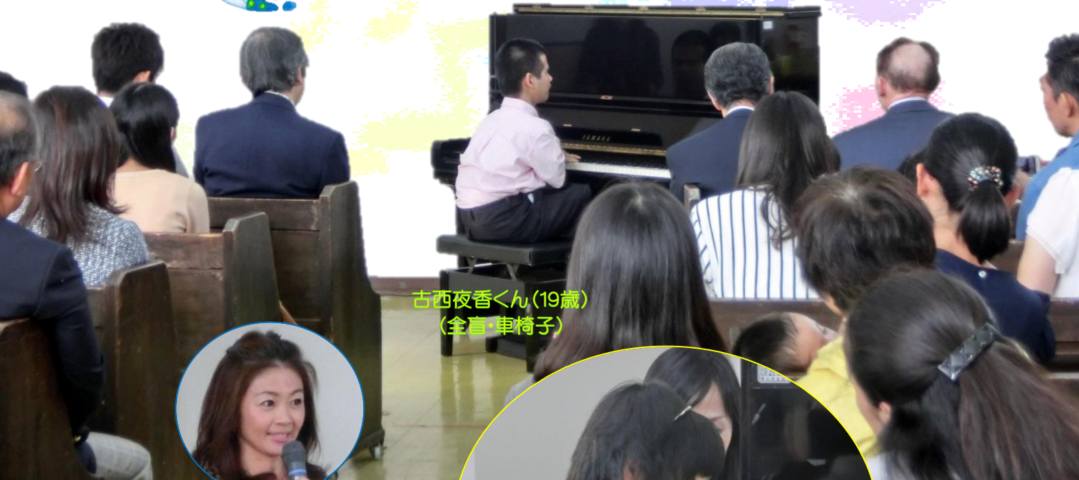
古西夜香くん(19歳) (全盲・車椅子)

第5回チャリティコンサート(10/12)のご報告 (裏面に収支報告を記載しております)